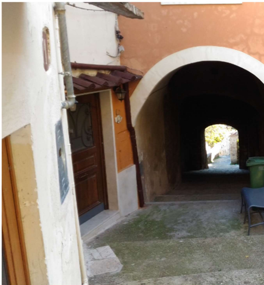
Accesso dalla piazzetta