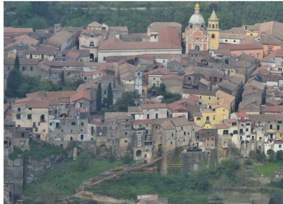
Veduta di insieme dell'intervento di riqualificazione della Porta in relazione con San Francesco in Vetere con San Francesco dentro le mura .

L'obiettivo è quello di proporre una pavimentazione in pietra locale bucciarata porta a listelli che rievoca il vecchio passaggio in legno. Da una parte il paesaggio è collegato con la località Bocca e con San Francesco in Vetere fuori le mura, dall'altra, Porta San Marco è collegata con San Francesco dentro le mura. La porta deve fungere come elemento attrattivo e fulcro, creando un percorso pedonale di fruizione, prevedendo anche cosiddetti "poggi" o sedili e aree espositive. In questo modo si va a collegare il paesaggio illuviale con il paesaggio mezzogiorno o il paesaggio mediano. La porta rappresenta dunque un legame tra presente, passato e futuro.