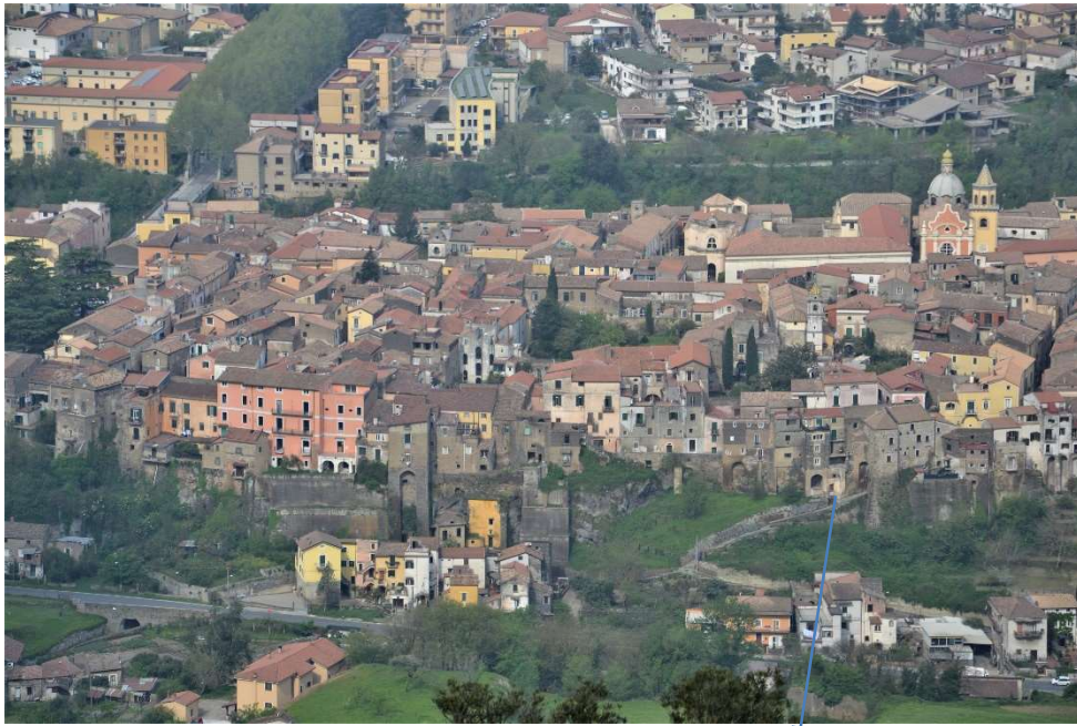
Veduta d'insieme della zona Est con la porta San Marco