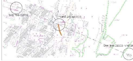
Stralcio aerofotogrammetrico della zona . IGM : tavola/ foglio 173 III N.O.