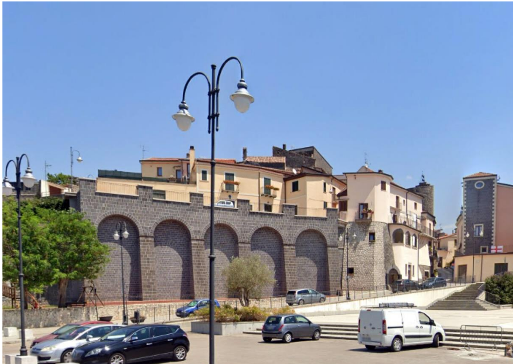
Ruviano, l'ingresso al centro abitato, 2007 e 2022.