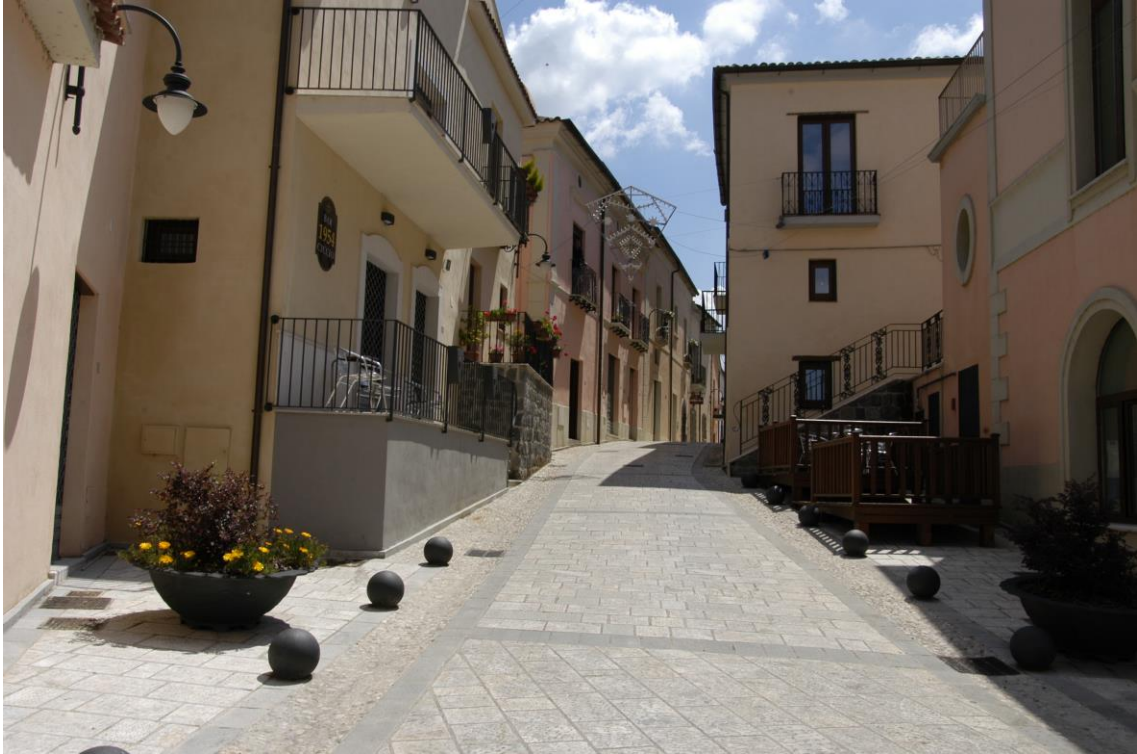
Ruviano, il centro storico dopo i lavori di restauro, 2022.