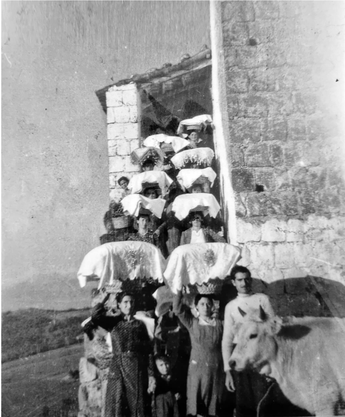
Ruviano, il matrimonio tradizionale nelle campagne, 1947.