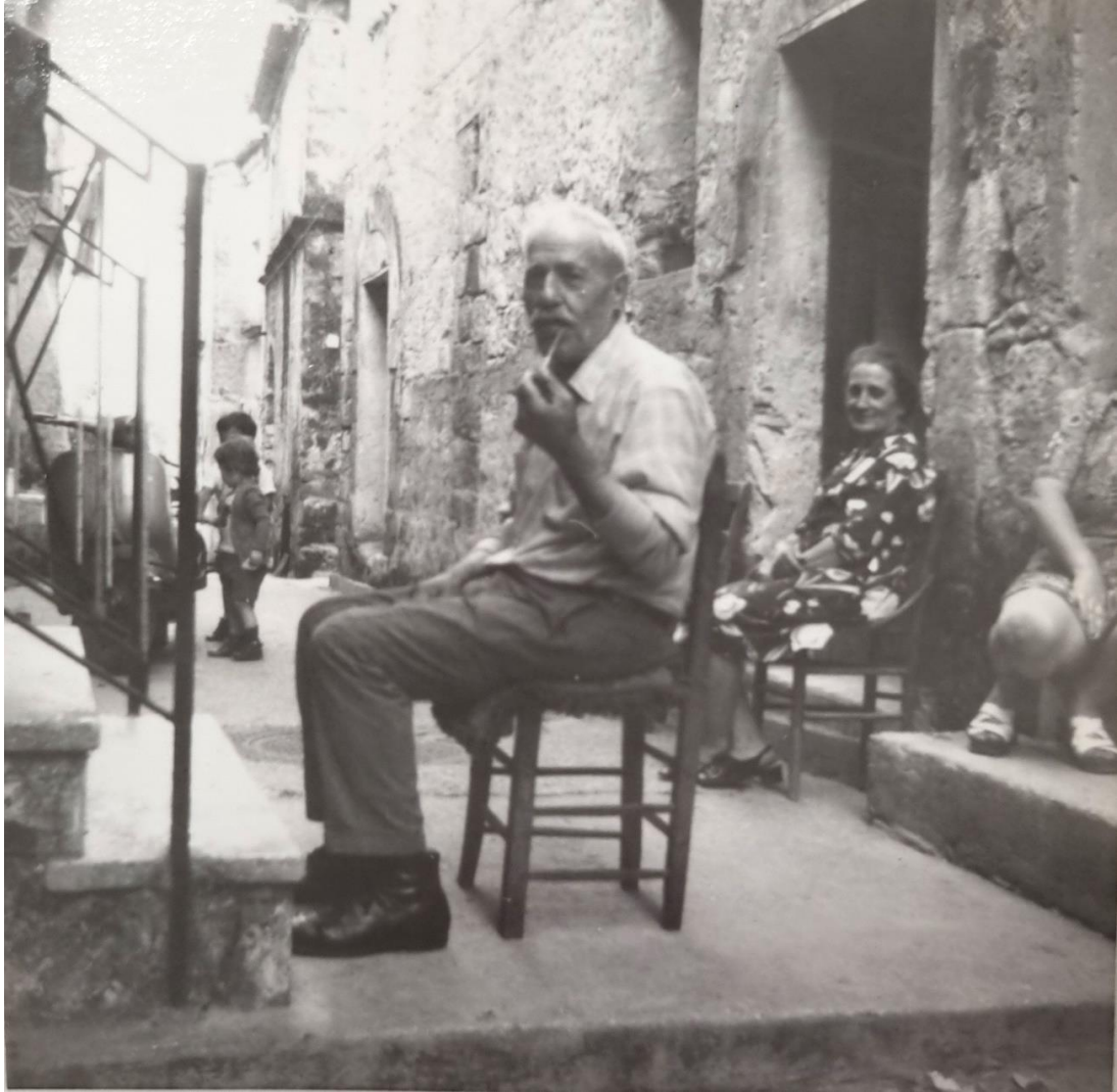
Ruviano, vita nei vicoli del centro storico, anni '60.