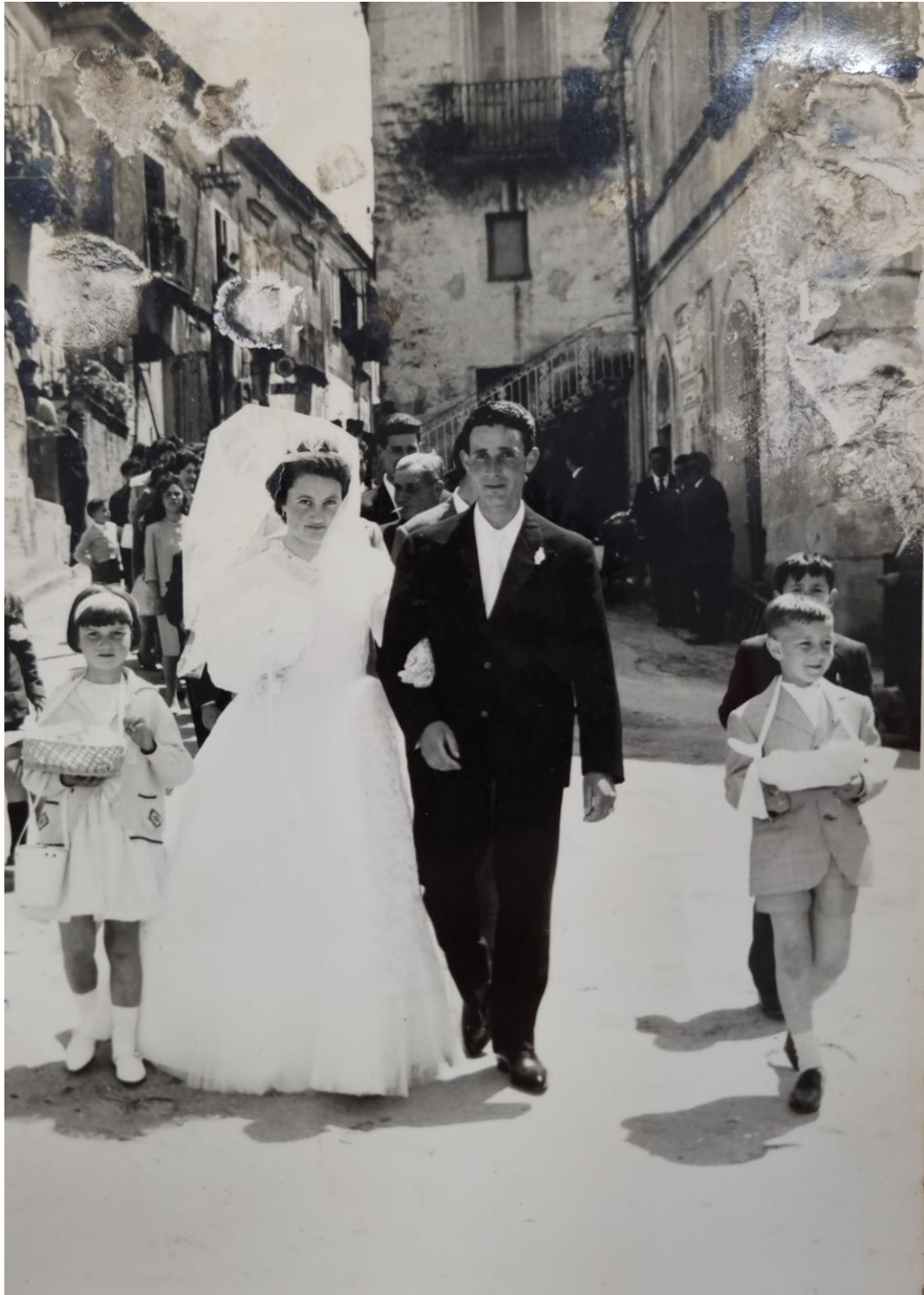
Ruviano, corteo matrimoniale nel centro storico, anni '60.