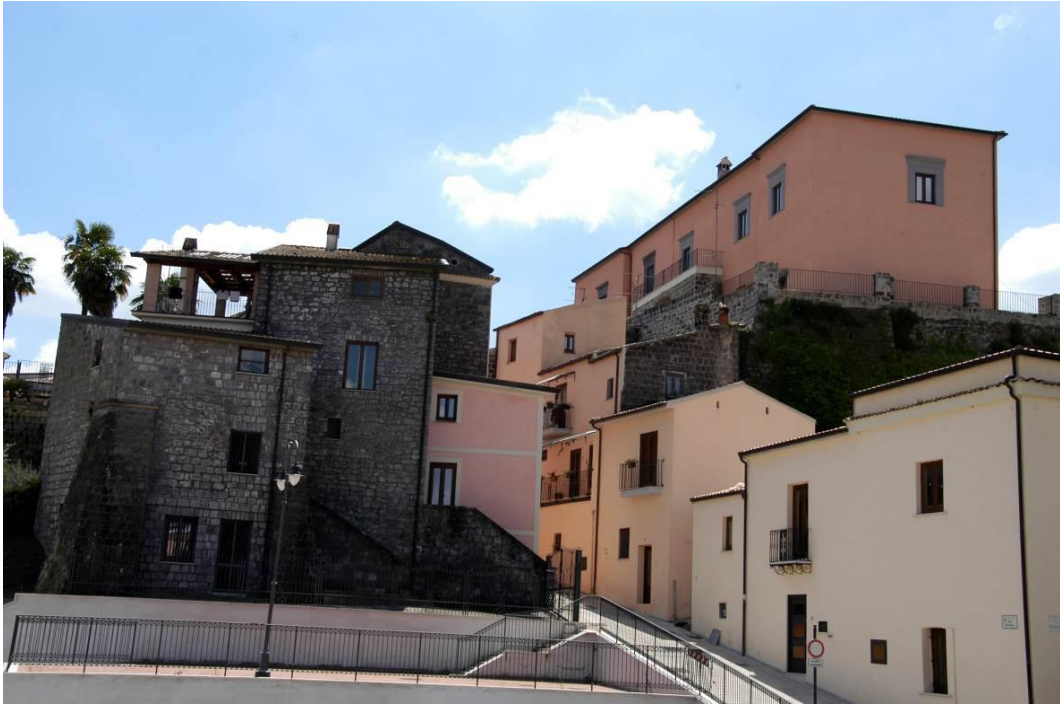
L'ingresso al borgo dopo i lavori di restauro, 2018.