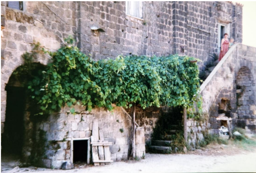
Ruviano, la vita nelle campagne, anni '60 e '70.