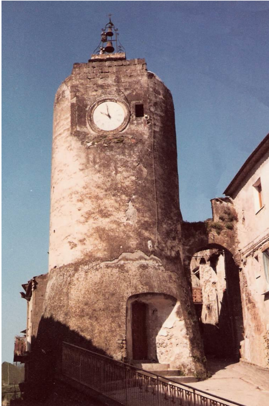
Ruviano, la torre dell'orologio a guardia dell'accesso al castello, anni '70.