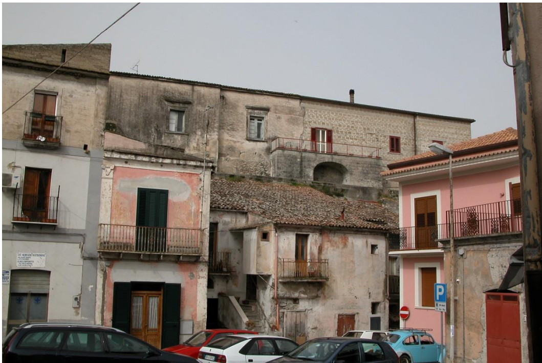
Il castello prima e dopo il terremoto del 1980, fine anni 70 e 2007.