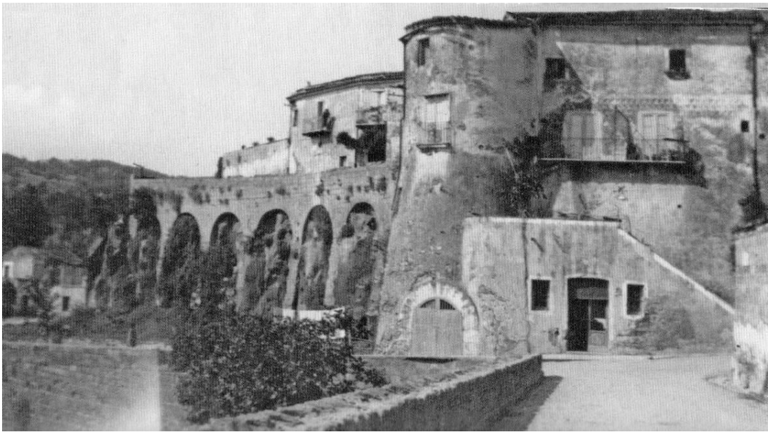
Ruviano, l'antico ingresso al centro abitato, anni '30 e fine anni '40.