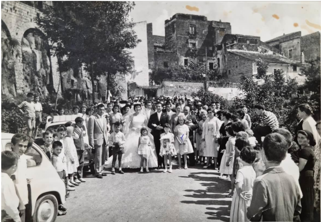
Ruviano, matrimonio in campagna e nel centro storico, fine anni '50 e anni '60.