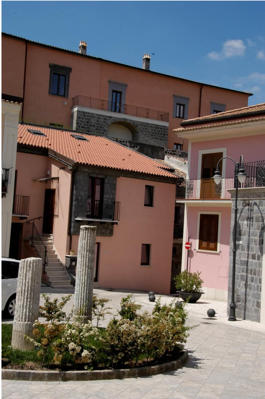
Il castello dopo i lavori di recupero del centro storico, 2018.