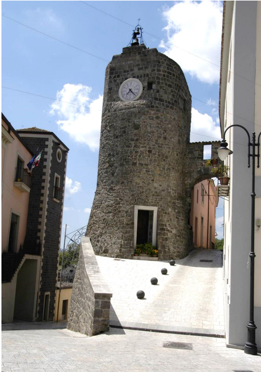
Ruviano, la torre dell'orologio a guardia dell'accesso al castello, 2017.