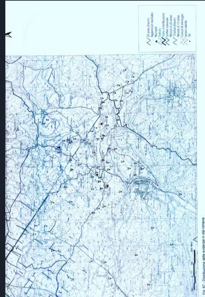
Fig. 67 - Distribuzione delle evidenze in età romana